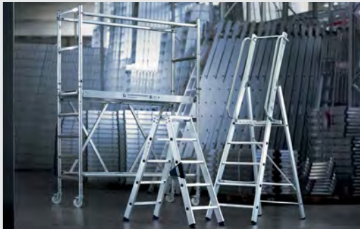
MUNK Günstzburger Steigtechnik

Die MUNK Rettungstechnik ist eine Marke der MUNK Group und steht für Feuerwehrleitern, Rettungsplattformen und Transportlogistik in Premium-Qualität.