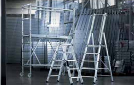
MUNK Günstzburger Steigtechnik

Die MUNK Rettungstechnik ist eine Marke der MUNK Group und steht für Feuerwehrleitern, Rettungsplattformen und Transportlogistik in Premium-Qualität.