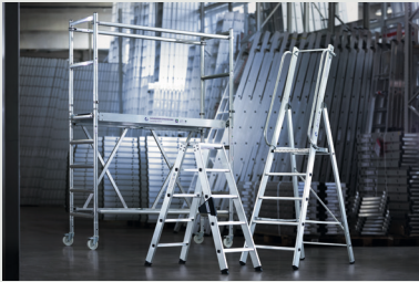
MUNK Günstzburger Steigtechnik

Die MUNK Günstzburger Steigtechnik ist eine Marke der MUNK Group und steht für Leitern, Rollgerüste und Sonderkonstruktionen in Premium-Qualität.