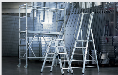
MUNK Günstburger Steigtechnik

MUNK Günstburger Steigtechnik ist eine Marke der MUNK Group und steht für Leitern, Rollgerüste und Sonderkonstruktionen in Premium-Qualität.