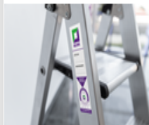
Bestell-Nr.: 019176 Inventaraufkleber