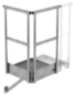
Bestell-Nr.: 060942 Grundpodest 800 x 800 mm