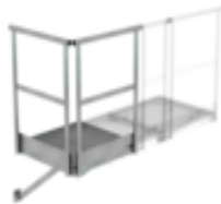
Bestell-Nr.: 060950 Grundpodest 1000 x 1000 mm