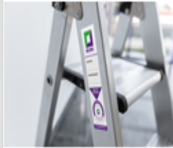
Bestell-Nr.: 019176 Inventaraufkleber