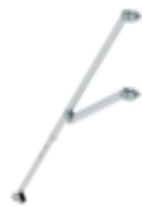
Planche de bordure frontale FlexxTower