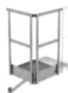
Plate-forme d'extension 500 x 1000 mm