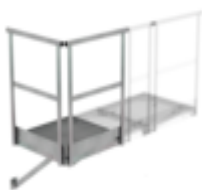
Plate-forme de base 800 x 800 mm