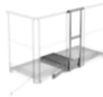
Plate-forme d'extension 1000 x 1000 mm