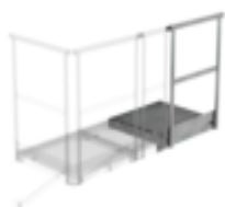
Plate-forme d'extension 800 x 800 mm