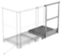
Plate-forme d'extension 500 x 1000 mm