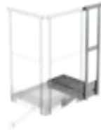
Plate-forme de base 1 000 x 1 000 mm