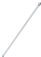
Planche de bordure latérale pour longueur d'échafaudage 2,45 m