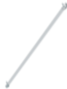
Planche de bordure latérale pour longueur d'échafaudage 1,8 m