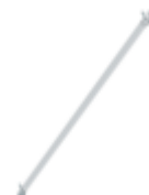
Planche de bordure latérale pour longueur d'échafaudage 1,8 m