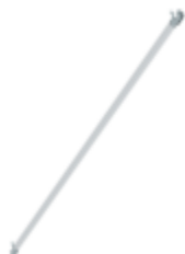
Planche de bordure latérale pour longueur d'échafaudage 2,45 m