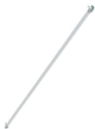
Planche de bordure latérale pour longueur d'échafaudage 3,0 m