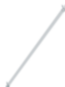
Planche de bordure latérale pour longeur d'échafaudage 1,8 m