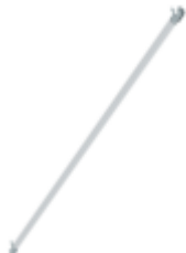
Planche de bordure latérale pour longueur d'échafaudage 2,45 m