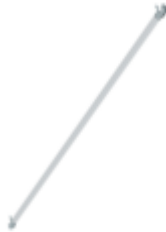
Planche de bordure latérale pour longueur d'échafaudage 2,45 m