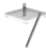
Plate-forme d'extension 1000 x 1000 mm