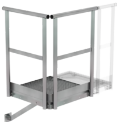
Plate-forme de base 800 x 800 mm