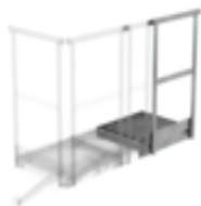
Plate-forme d'extension 400 x 800 mm