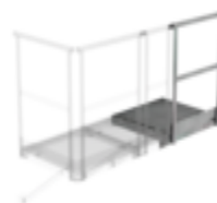
Plate-forme d'extension 500 x 1000 mm