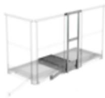
Plate-forme d'extension 800 x 800 mm